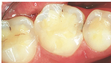
Kindtænder med svære syreskader.