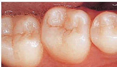
Sunde kindtænder med intakt emalje.