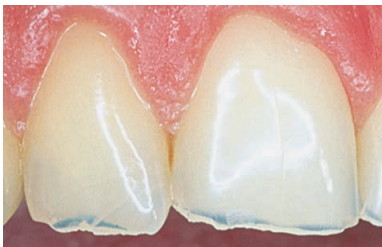
Fortænder med ætset emalje og slidte skærekanter.