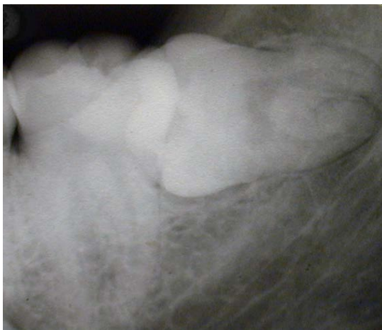
Røntgenbillede af visdomstand.

En del visdomstænder kommer aldrig frem i munden, men bliver liggende i kæben og kan ligge der uden at gøre skade.