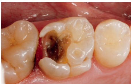
Her ses et stort cariesangreb på en kindtand.

før eller siden smuldre, og der opstår et hul i tanden. Hvis opløsningen fortsætter, kan angrebet nå helt ind til nerven i tanden, så tanden må rodbehandles. Caries udvikles på tyggeflader og på de flader, der vender mod nabotænderne. Hos ældre mennesker opstår caries også på tændernes rødder. Caries kan desuden opstå i en spalte mellem en tand og en fyldning.