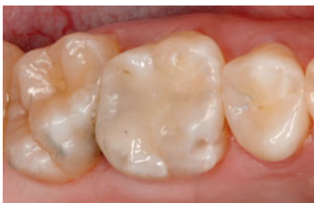
Her er cariesangrebet blevet behandlet med en plastfyldning.