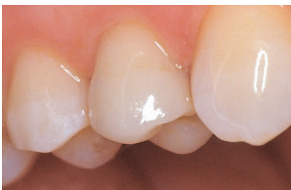
Samme tand med det færdige porcelænsindlæg.