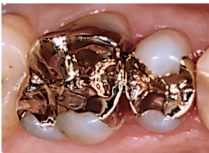
Begge kindtænder er behandlet med guldindlæg.