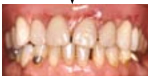
Før og efter protesebehandling, hvor tænderne er blevet pænere

Hvis du fx har haft en enkelt mørk tand, kan dette også efterlignes på protesen, hvis du ønsker det. Og har du mange plomber, guldindlæg eller kroner, så kan det ligeledes genskabes på den nye protese. Protesetænder kan i dag udføres så naturtro, at ingen vil opdage, at du har fået protese.