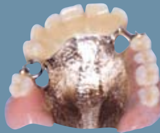
Delprotese med støbt stel til overmunden.

En delprotese med et støbt stel kan udformes, så den fylder mindre end en protese af akryl. Den bliver derfor nemmere at vænne sig til, og den ser som regel også pænere ud.