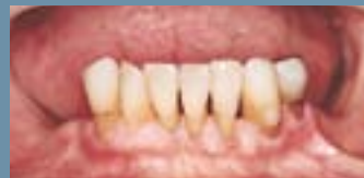
De manglende kindtænder erstattes med en delprotese.

Disse små slibninger skader ikke tænderne, fordi der som regel kun slibes af emaljelaget.