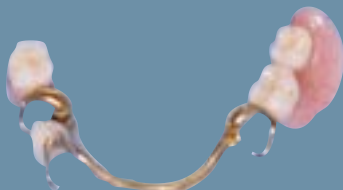
Protesetænder på støbt stel.

En langt bedre form for delprotese er den med et støbt stel, kaldet en unitor. Her er bøjlerne og en eventuel ganeplate fremstillet i støbt metal (som regel en blanding af krom og kobolt). Dette er hårdt metal med stor styrke. Det betyder, at man kan bruge metallet i ganske tynde lag og alligevel opnå, at protesen bliver tilstrækkelig solid.